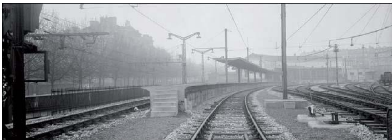
La gare de Denfert-Rochereau de 1930 à 2014

Entre 1930 et 1987 : La voie 3 et le quai 3 étaient encore utilisés. La gare connaît sa configuration actuelle depuis 1937 lors de l'électrification de la ligne.